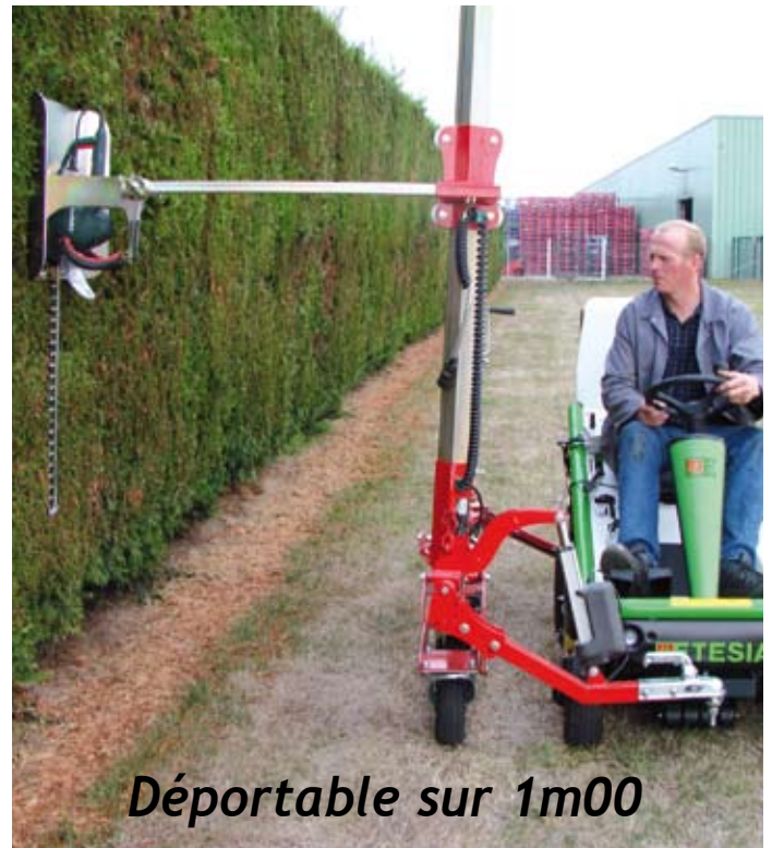
Déportable sur 1m00

Le taille-haie électrique est fixé de façon démontable afin de pouvoir continuer à l'utiliser de façon traditionnelle et manuelle pour les finitions des parties non accessibles avec le tracteur-tondeuse.