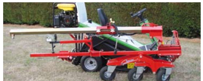
Faible encombrement pour un rangement facile