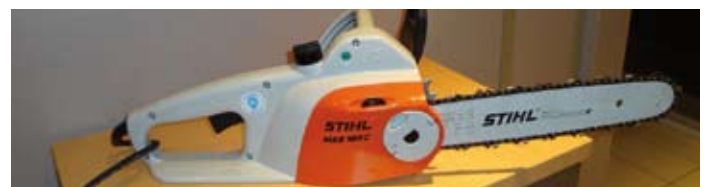
Il se transforme en tronçonneuse